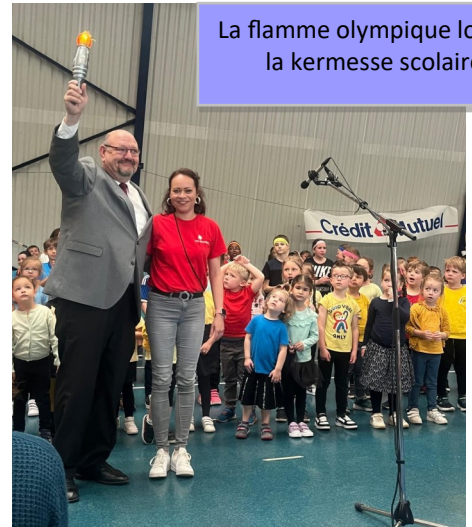
La flamme olympique lors de la kermesse scolaire