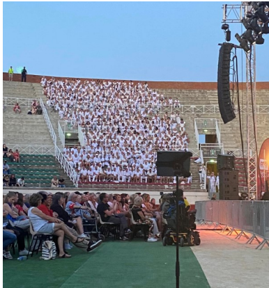
La chorale Clé des chants chante aux arènes de Béziers