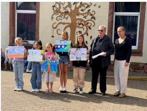
Concours de dessins du Crédit Mutuel