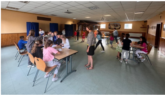
Elections et installation du CME