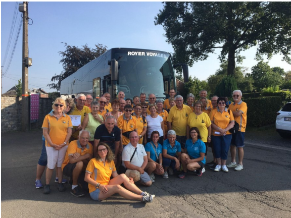
Wescherblattel n° 107 : parution fin mars 2025